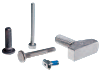
Kallstukning / Varmformning

Med Bufab som samarbetspartner erbjuds omfattande kunskaper och teknisk support inom flertal produktionsmetoder.