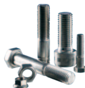
DIN / ISO fästelement

Bufab erbjuder ett omfattande sortiment av standardprodukter till den industriella byggbranschen.