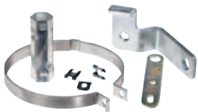
Plåtstansning / Laserskärning