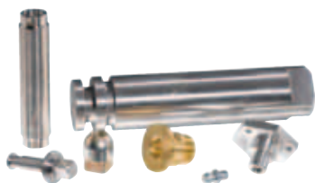
Svarvning / Fräsning