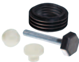
Formsprutning / Gummiproduktion